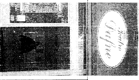
«Delirio» al Palafre 2